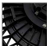
radiator odprowadzający ciepło