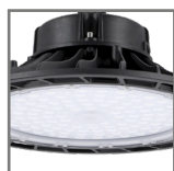
źródło światła LED