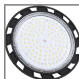
wymienne soczewki 110°/90°