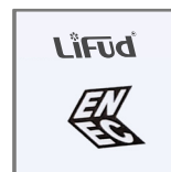
wbudowany zasilacz LIFUD